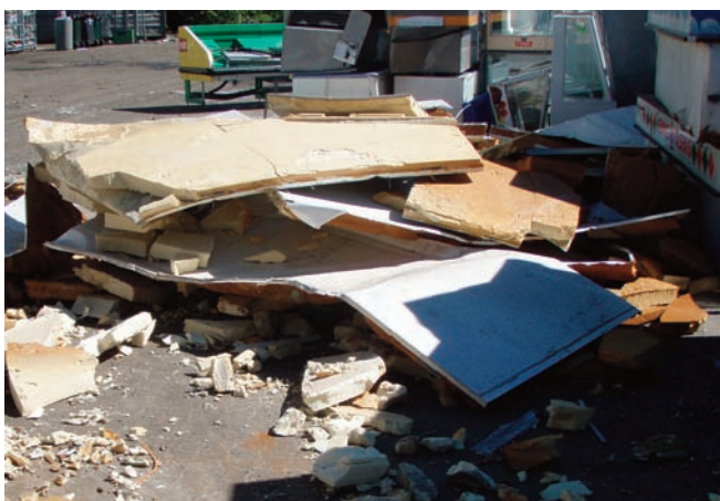
Olje, asbest og isolasjon (KFK, HKFK)