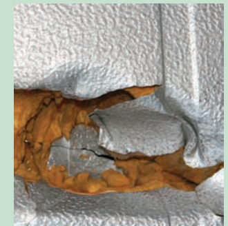
Asbest, vinyltapet, vinylgulvbelegg og PUR isolasjon