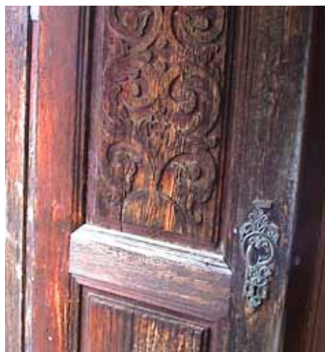
Gårdsbruket Jorlia representerer byggeskikk av høy klasse i Rennebu. Som i Trøndelag ellers kjennetegnes bebyggelsen av enkle former og rette linjer. Detaljering og dekor markerer våningshusets finere detaljer, hovedinngang, dører og vinduer.