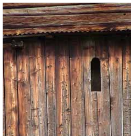
Enkle virkemidler skaper uttrykksfulle detaljer. "Less is more"