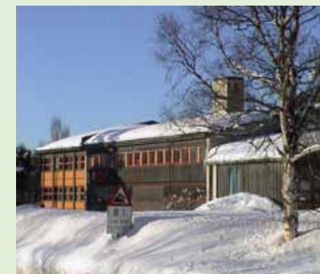
Sentrumsbebyggelsen på Berkåk har flere eksempler på godt arkitekthåndverk i etterkrigstida.