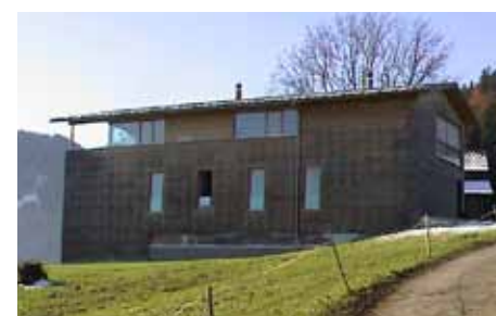
Et moderne hus i harmoni med omgivelsene. Moderne fasadeløsninger i tradisjonell hovedform.