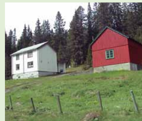
Mindre dimensjoner er det over småbruket på Rennebuskogen.