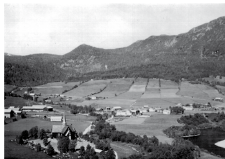
På dette bilde fra Vollagrenda sees den typiske teigdelingen på tvers av dalsiden.

• Ny bebyggelse kan etableres etter tilsvarende mønster, tilpasset landskapsrom, linjer, oppdelinger og elementer i landskapet.