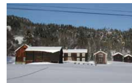
Et vakkert gårdsbruk: Sammensetning av små og store volumer med ulike funksjoner og uttrykk. Skjerve i Rennebu.

For å øke bevisstheten om byggeskikkens betydning, utarbeider Rennebu kommune en veileder for byggeskikk rettet mot utbyggere, saksbehandlere og publikum. Veilederen skal vise hvordan trekk fra eksisterende landskap og bebyggelse kan gi føringer for planlegging og utforming av ny bebyggelse. Den skal gi bevissthet om forutsetninger for god byggeskikk og estetisk kvalitet i omgivelsene.