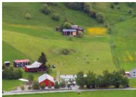
Gårdsbruk og innmark er i drift.