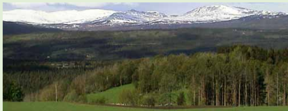
Rennebu er sammensatt av ulike landskapstyper: Høyfjell, skog, li, dal.