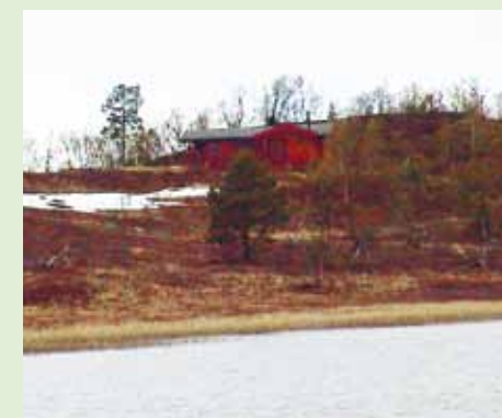
Med nennsom regulering, varsom terrengbearbeiding og god utforming kan fritidsbebyggelse framtre som harmoniske elementer i landskapet.

Nedlegging av gårdsbruk og usikre tider for landbruksnæringen fører til at mange bygninger i landbruket står tomme.