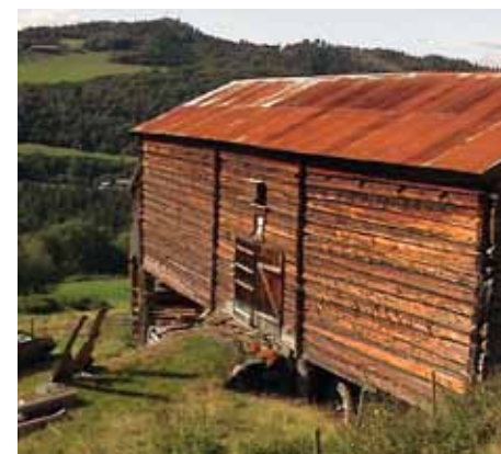
Uthusene i Rennebu er enkle bygningskropper der lafteknuter, luftespalter, struktur og farge utgjør fasadens uttrykk. Jorlia, Rennebu.

Hver region, landsdel og hvert sted i Norge har hatt sin egen måte å utforme bebyggelsen på, sin egen byggeskikk. Dette førte til en harmonisk og enhetlig bebyggelse på stedet.