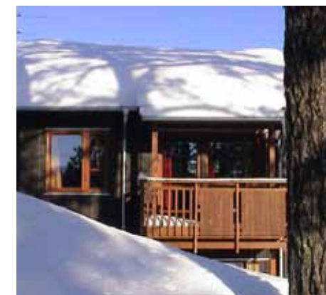
Nye omsorgboliger på Berkåk viser god utforming av nye byggeoppdrag. (Ark. Eggen arkitekter)