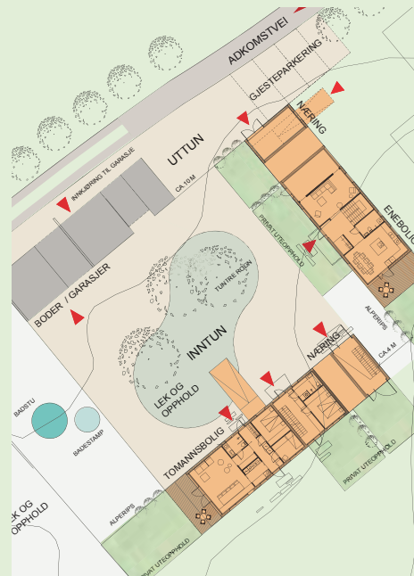
Illustrasjoner: Lerche Arkitekter as

“Bolyst” er en arkitektkonkurranse utlyst av Husbanken og BliLyst i 2006. På tomta Trondskogen i Rennebu ønsker Rennebu kommune å få realisert vinnerutkastet forfattet av Lerche Arkitekter AS. Prosjektet viser bolig- og næringsbebyggelse i tunform. Inspirert av trøndertunets flerbruksfunksjoner og enkle formspråk skapes frodige