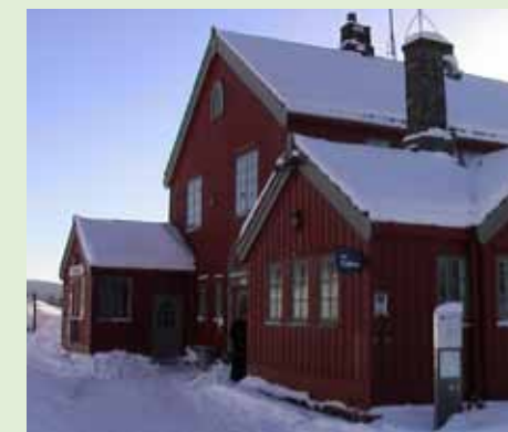
Jernbanestasjonen på Berkåk er utformet i nasjonalromantisk stil, et staselig anlegg.