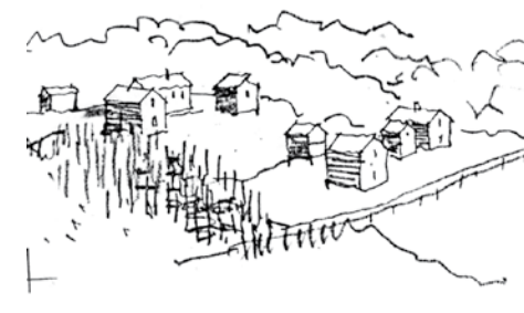
Bygningene i tunet ligger med utmarka rundt. Før utskiftningen kunne flere tun ligge sammen i klynger.