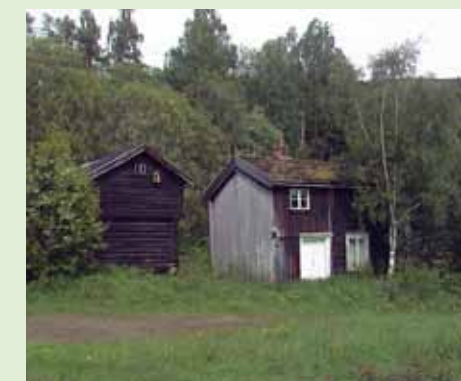
Feriebruk av gårder og småbruk kan forlenge livet til landbruksbebyggelse ute av bruk.

Rennebu kommune håndhever boplikten strengt for å bevare den faste bosettinga. Gårdsturisme og annen småskala virksomhet skal styrke livsgrunnlaget og bosettinga på bygda. Et levende bygdesamfunn og et velpleid kulturlandskap, gjør bygda til et attraktivt mål for reiseliv og fritidsbruk.