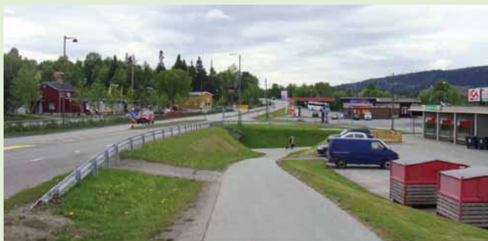
Berkåk er kommunesenteret i Rennebu der E6 passerer gjennom sentrum.