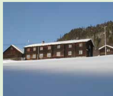
Høyt og fritt ligger gårdsbruket på Flå med våningshusets storslåttestil mot bygda.