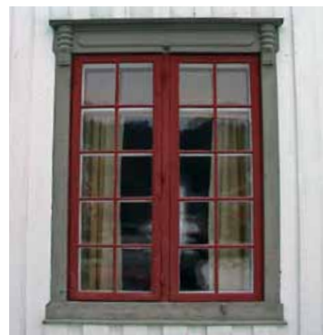
Empirestilen som var vanlig på første halvdel av 1800-tallet har et rent og elegant uttrykk.

Malingen beskyttet trepanelet. Bruk av maling med jordpigmenter (gule, brune, røde farger) var vanlig fra 1700-tallet. Det hvite fargepigmentet var svært kostbart, men da det ble tilgjengelig for en rimelig penge, ble hvit den vanligste fargen på trønderlåna.