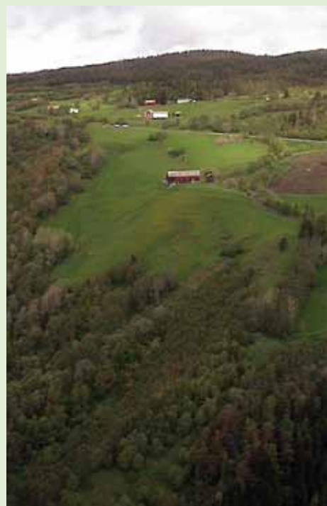
Kulturmarka utgjør glenner i de skogklede dalsidene.