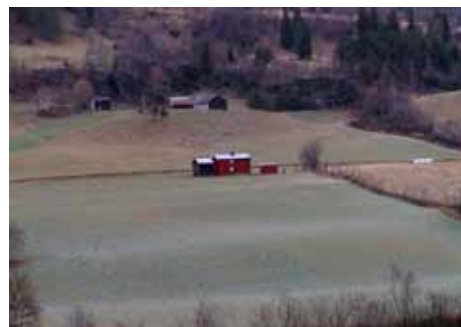
Bebyggelsen understreker linjer i landskapet.