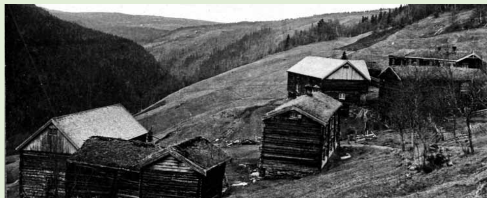
De første gårdene ble ryddet opp i lia der klima var mildere og jorda mer lett dyrket etter datidens metoder. Gårdsbruk på Havdal 1924.

Kirkestedet på Voll var kommunens viktigste bygdesenter før offentlig administrasjon og service ble sentralisert på Berkåk på 1960-tallet. Kommunesenteret Berkåk har senere blitt kommunens vekstsenter.