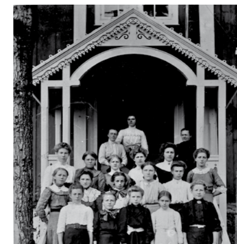
På trøndelåna uttrykker sveitserstilen seg med fint dekorerte verandaer og inngangspartier, som her på prestegården i Rennebu i 1912.

trønderske byggeskikken. "Svevende" tak med store takutstikk, båret av profilerte raftsperrer og hanebjelker, utskjæring og dekor i gavl, på vindskibord og møne. Løvsagerarbeid på inngangsparti og profilert listverk lever sitt eget liv som "spindelvevsnett" utenpå bygningskroppen.