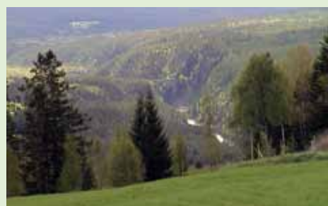
Bratte dalsider og elvegjel er karakteristisk for dalføret i sør.