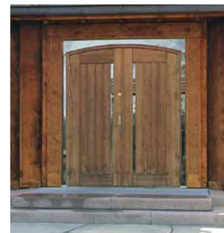
Hoveddøra framheves som et viktig element på fasaden. Den nye kirka på Innset viderefører dekorert omramming, lysinnslipp og solide dørheller.

Sveitserstilen som kom på slutten av 1800-tallet brøt med den nøkterne