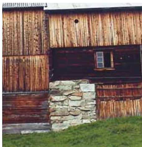
Ubehandlet overflate viser farge og struktur som varierer etter værslitasje og eksponering mot forskjellige himmelretninger.

Stående trepanel ble brukt til kledning av bindingsverk og for å beskytte tømmervegger i laft mot oppsprekking og råte. Kledningen på trønderlåna ble høvlet og ofte profilert, lagt med over- og underbord som tømmermanns-panel. Uthus har enkelt låvepanel, bord lagt kant i kant, ubehandlet eller malt.