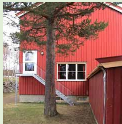
Fine kvaliteter i skolebygninger fra 1960-tall på Berkåk.

Berkåk og Ulsberg er trafikknutepunkt i regionen og landsdelen.