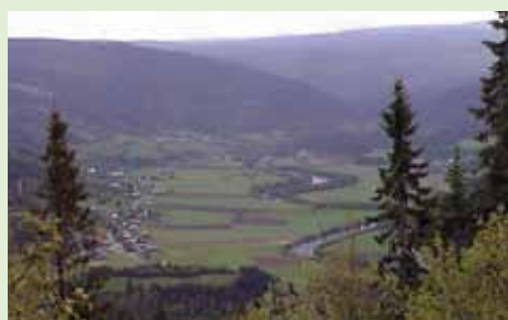
Nede i bygda slynger Orkla seg rolig i dalbunnen.