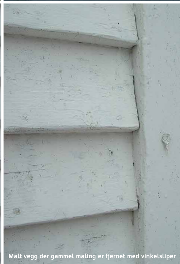
Malt vegg der gammel maling er fjernet med vinkelsliper