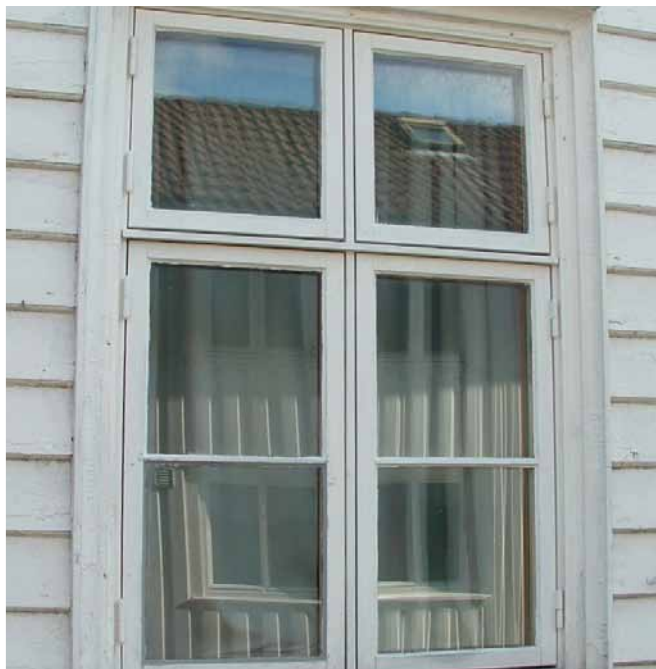
Originalt krysspostvindu – Kirkegaten 22

Et alternativ til koblede vinduer er vindu med enkelt isolerglassvinduer satt i kittfals, for eksempel av typen Isospross, Isokitt og lignende. Denne løsningen kan være aktuell i vinduer uten sprosser, f. eks. krysspostvinduer. Løsningen vil også kunne vurderes for andre typer vinduer. Det er viktig å ta kontakt med kommunen før vindustype velges.