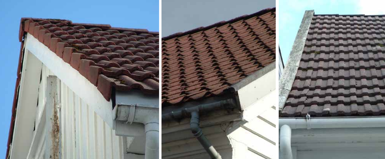
Taktekking av betongstein og takrenner av plast har ingenting på et 1800-tallshus å gjøre. Taket skal ikke avsluttes med kantstein mot gavl, men av solbord (som på bildet til høyre)