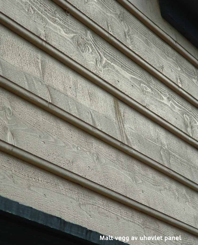
Malt vegg av uhøvlet panel