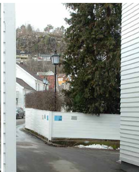
Dr. Kraftsgate 17