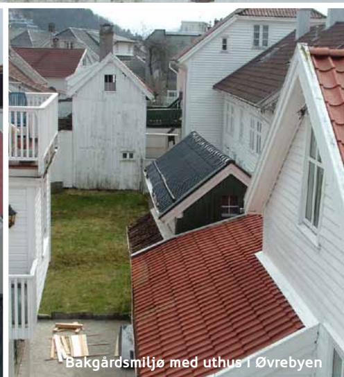
Bakgårdsmiljø med uthus i Øvrebyen