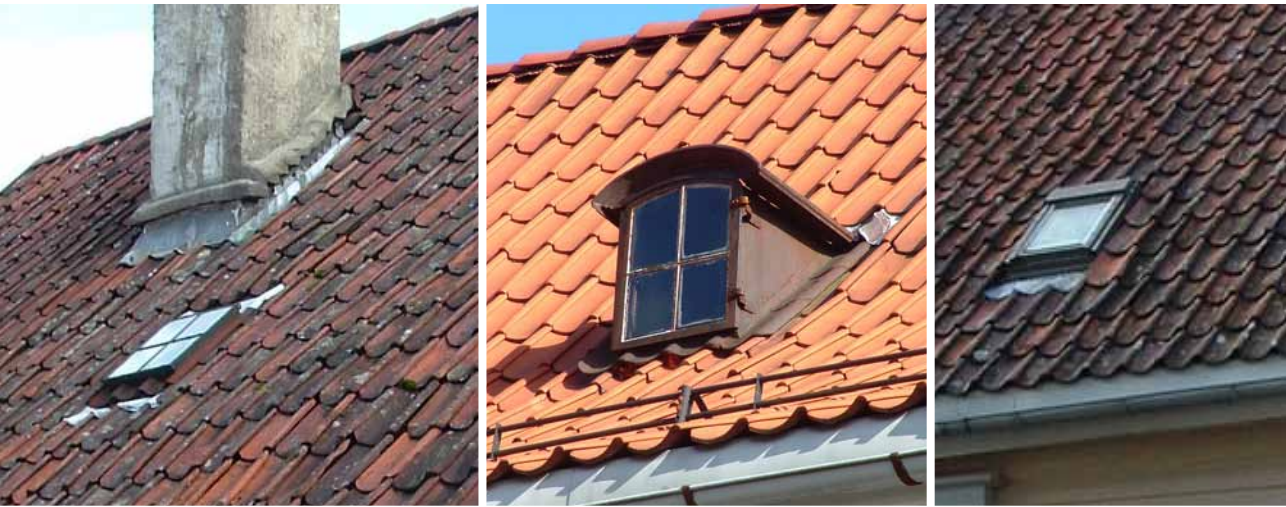
Gamme takluke, takvindu i form av takoppbygg i støpejern og moderne takvindu

Takvinduer har tradisjonelt vært utformet som takluker i støpejern, i noen tilfeller som et lite takoppbygg. Gamle takluker er mindre velegnet som vinduer i oppholdsrom. Moderne takvinduer bør kunne aksepteres i takflaten mot gårdsrom, hage eller lignende. Mot gaten bør takvinduer unngås eller begrenses til vinduer av minste størrelse (glugger).