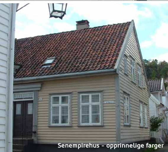
Senempirehus - opprinnelige farger