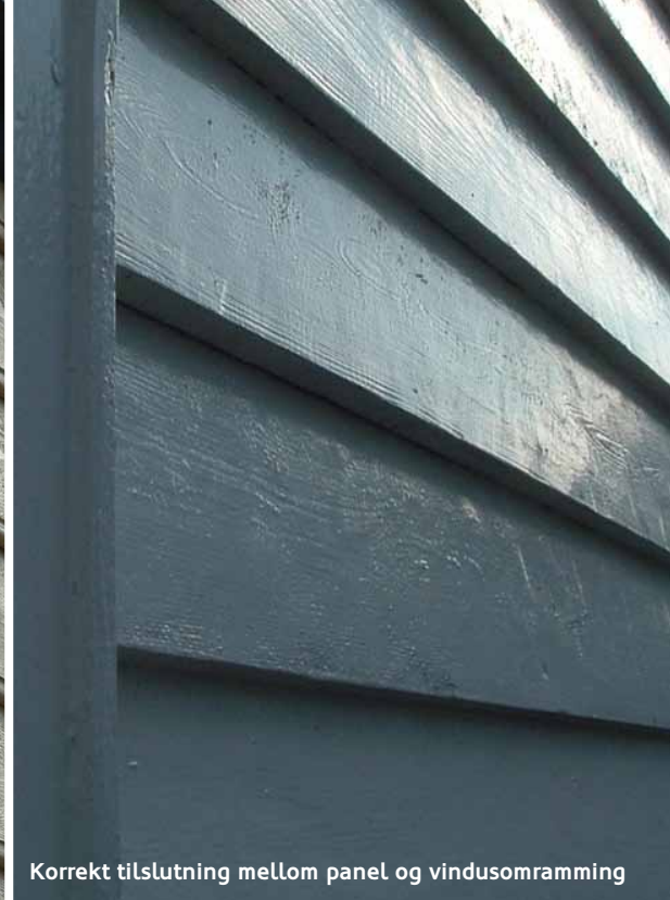
Korrekt tilslutning mellom panel og vindusomramming