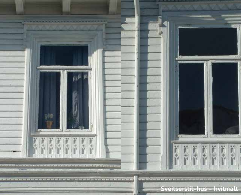
Sveitserstil-hus - hvitmalt