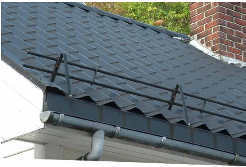
Taktekking av metallplater er uakseptabelt på 1800-talls hus (feil detaljering og feil alderstegn).