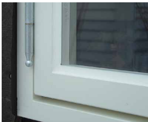
Vindu med enkelt isolerglassvindu satt i kittfals (Isospross)