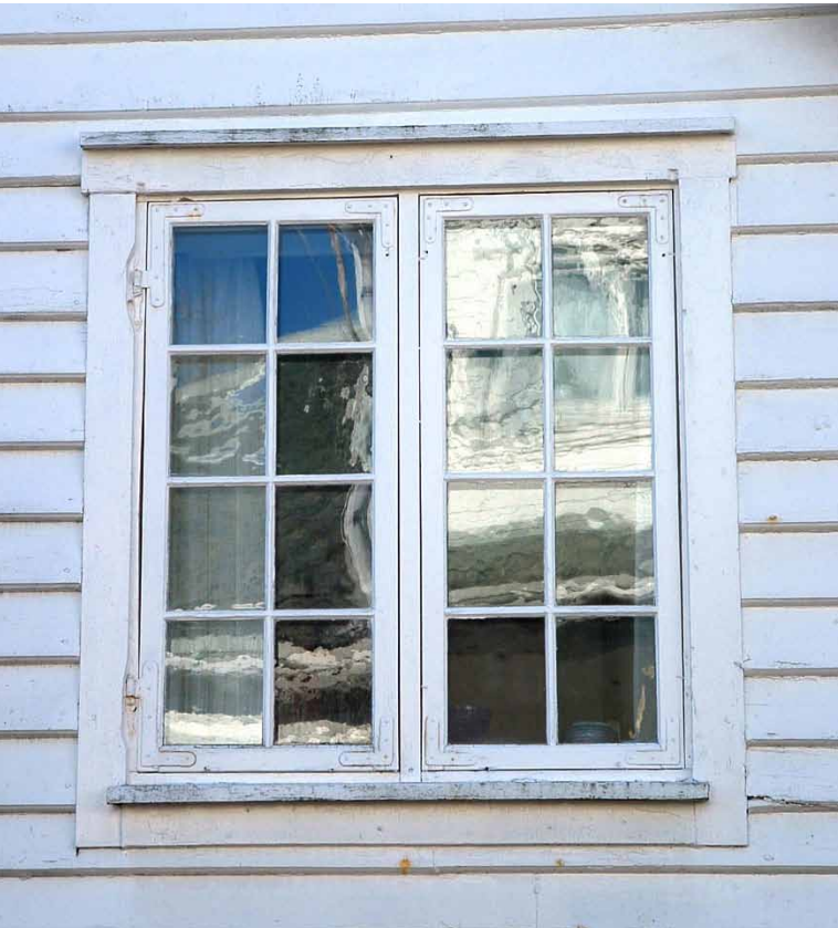
Reparert vindu – Hidragaten 7