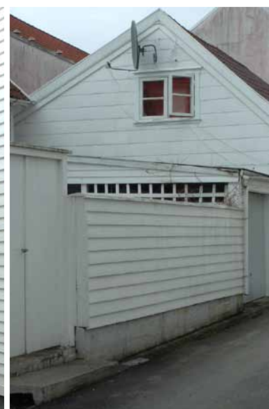
Vestre gate 8