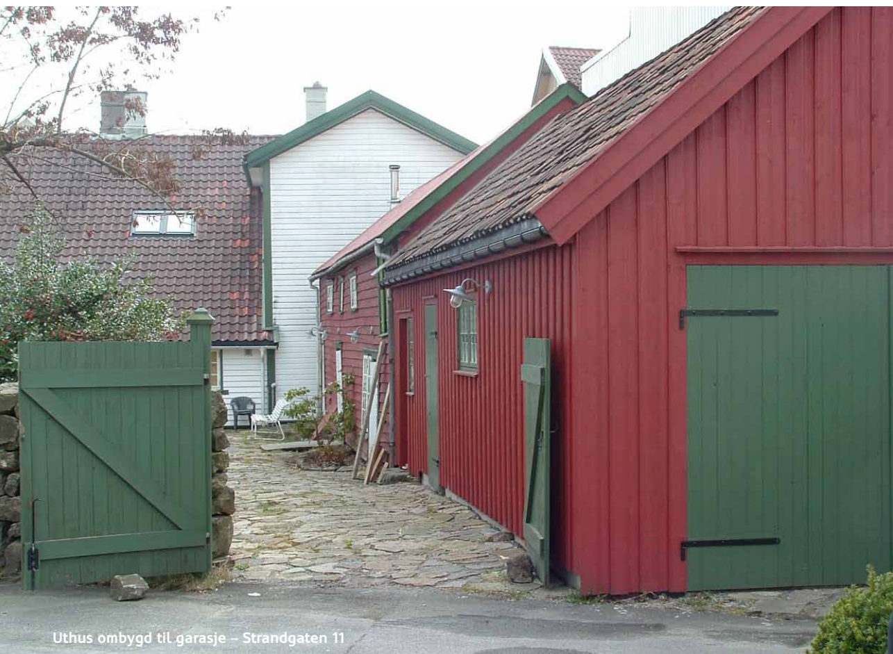
Uthus ombygd til garasje – Strandgaten 11

Uthusene utgjør en viktig del av bygningsmassen i bykjernen. Uthusene vitner om en tid da livsvilkårene var vesensforskjellig fra i dag. Uthusene er også viktig for bybildet. Særlig viktige er uthus som grenser til gate eller som er tydelig synlig fra gateplan.