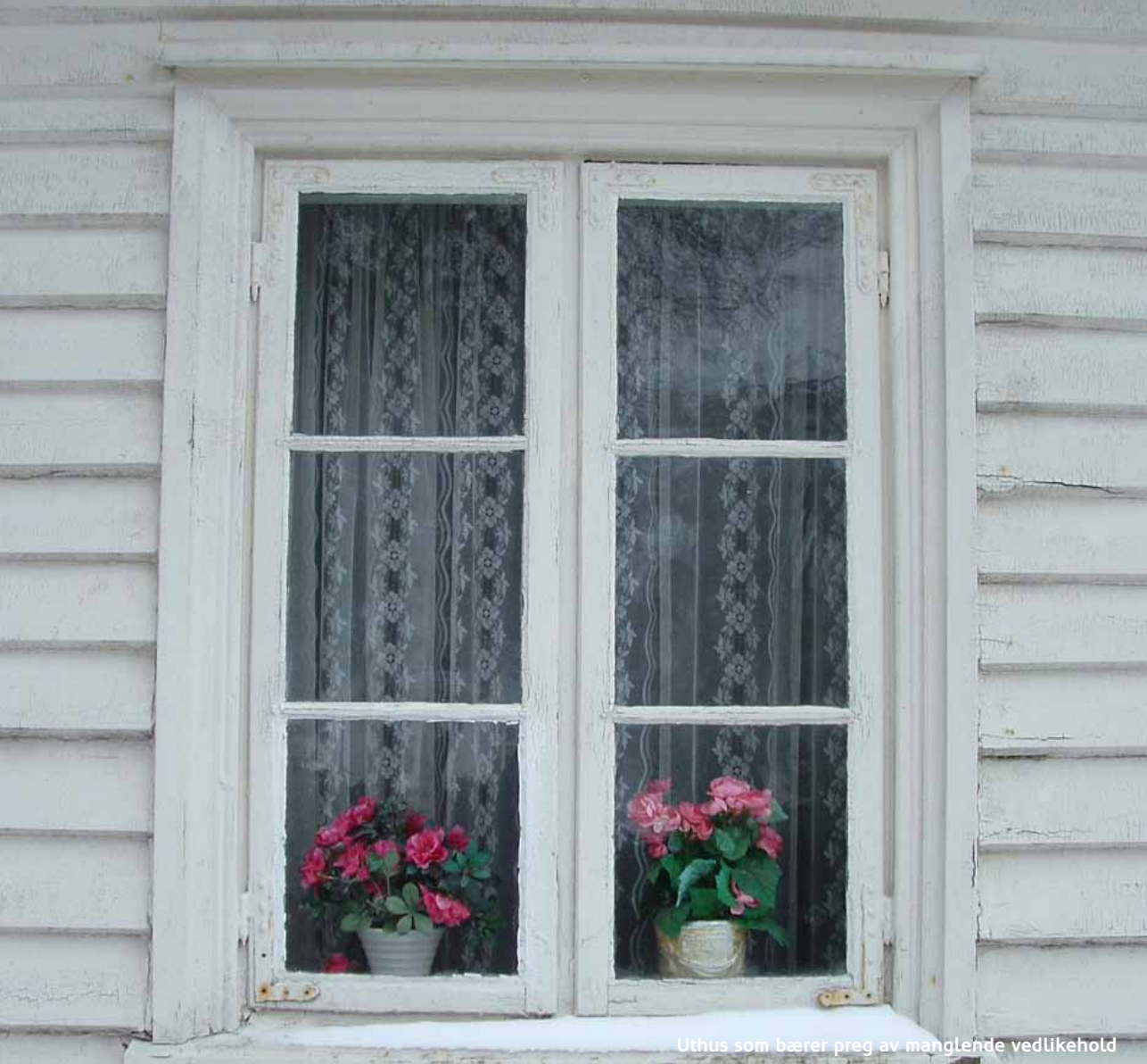
Uthus som bærer preg av manglende vedlikehold