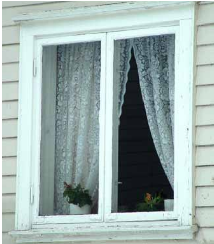
Originalt vindu og original omramning – funksjonalisme