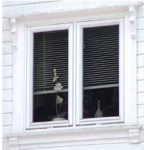
Nytt vindu – glasslist av tre m/ beslag. Feil type omramning

En viktig del av et vindu er utvendig belistning. Bildet til venstre ovenfor viser et originalt vindu i et hus oppført rundt 1950. Den enkle belistningen rundt vinduet er typisk for etterkrigsfunksjonalismen. Bildet til høyre viser et nytt vindu i et hus fra samme periode der den originale belistningen er erstattet av en ny belistning i en slags "nysveitserstil". Denne løsningen er ikke akseptabel sett fra et antikvarisk synspunkt.