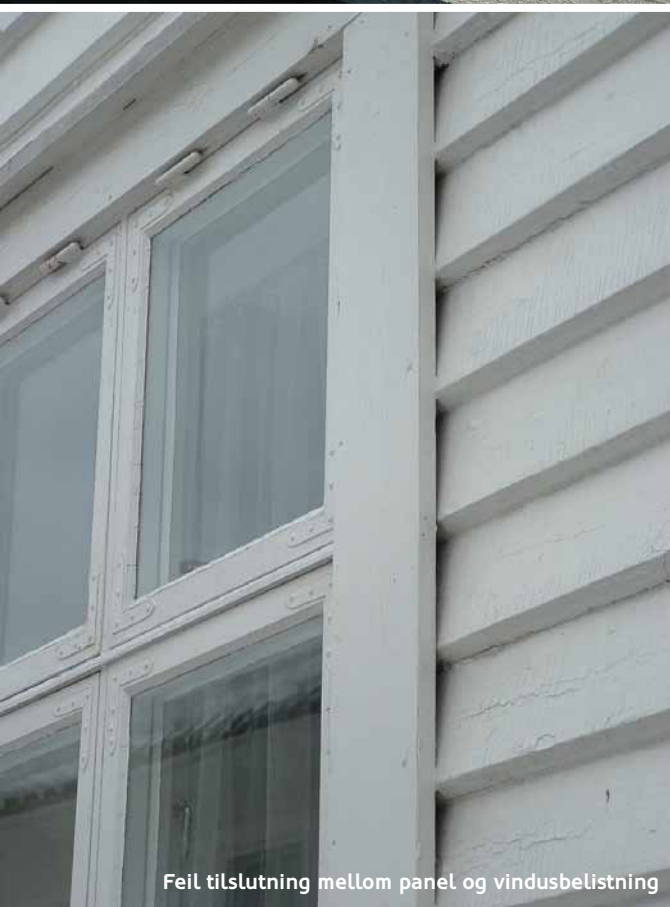
Feil tilslutning mellom panel og vindusbelistning