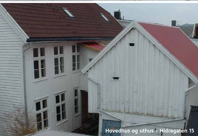
Hovedhus og uthus - Hådragaten 15