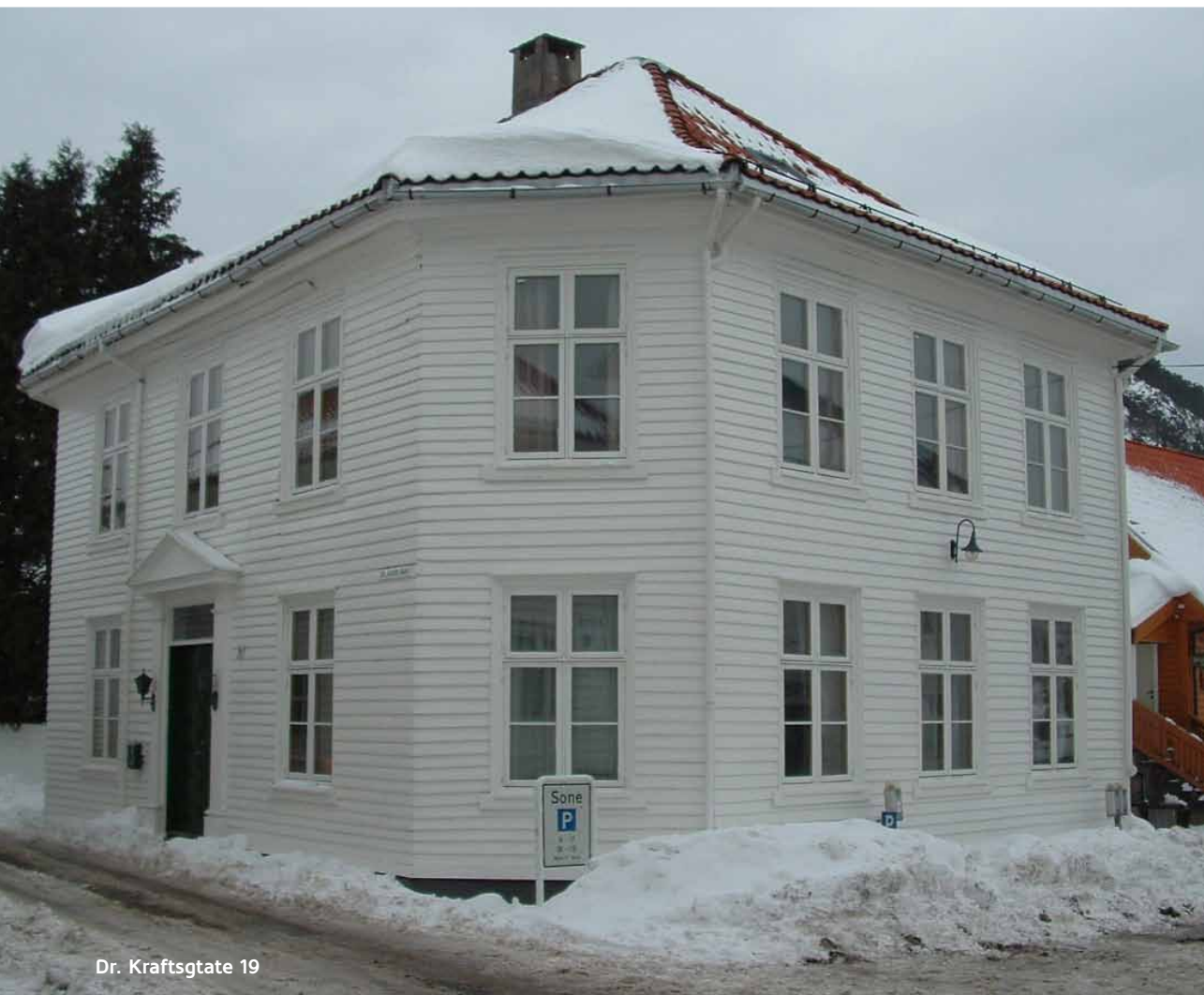
Dr. Kraftsgate 19