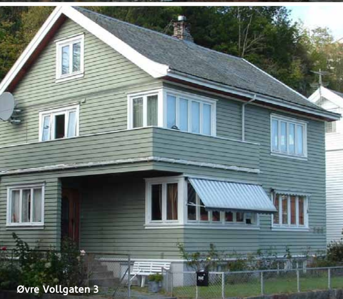
Øvre Vollgaten 3