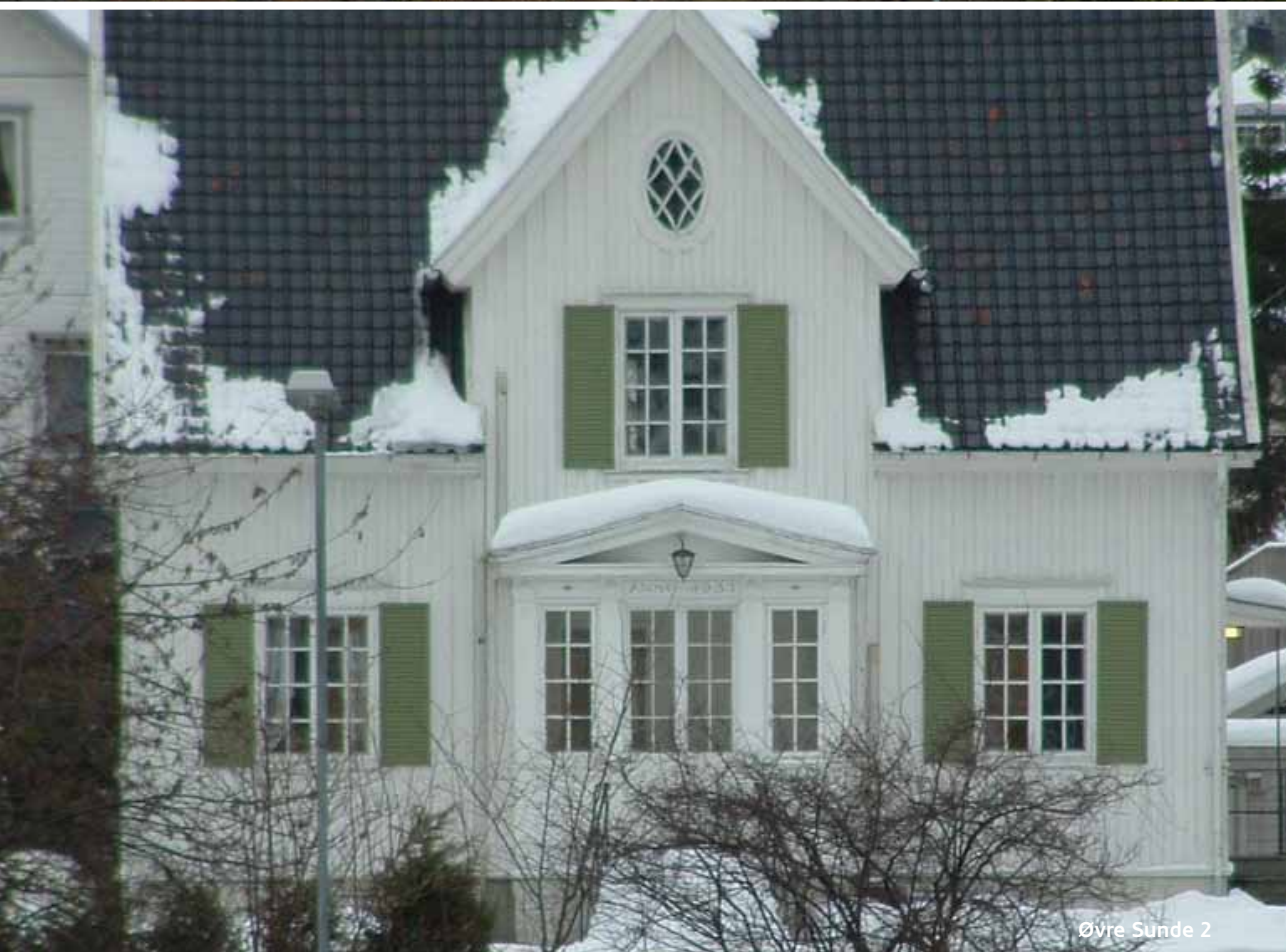
Øvre Sunde 2