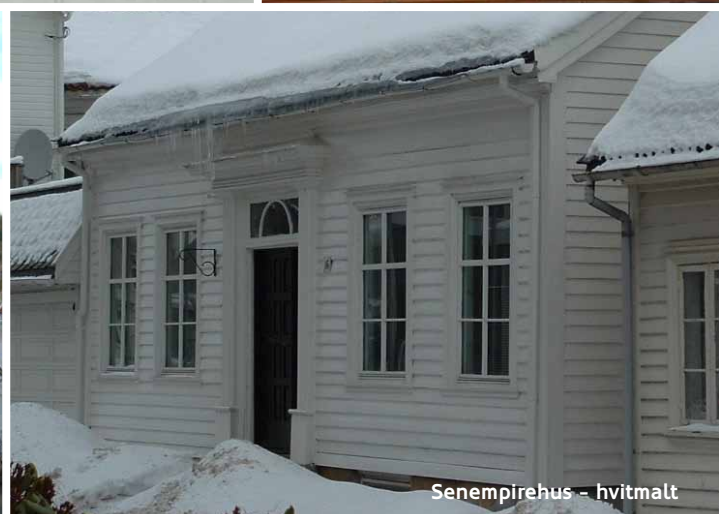
Senempirehus - hvitmalt