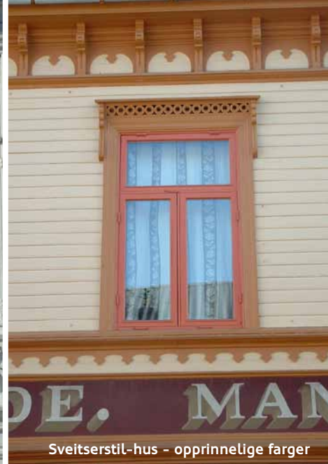
Sveitserstil-hus - opprinnelige farger