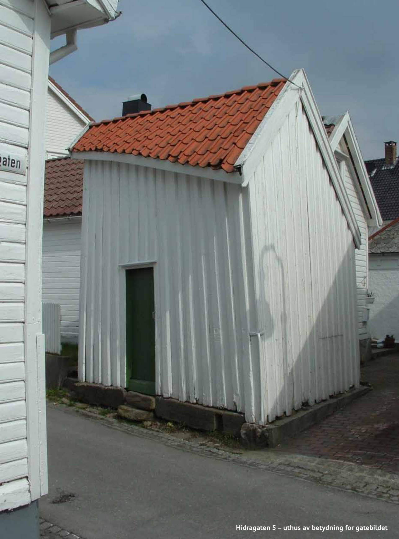
Hidragaten 5 – uthus av betydning for gatebildet