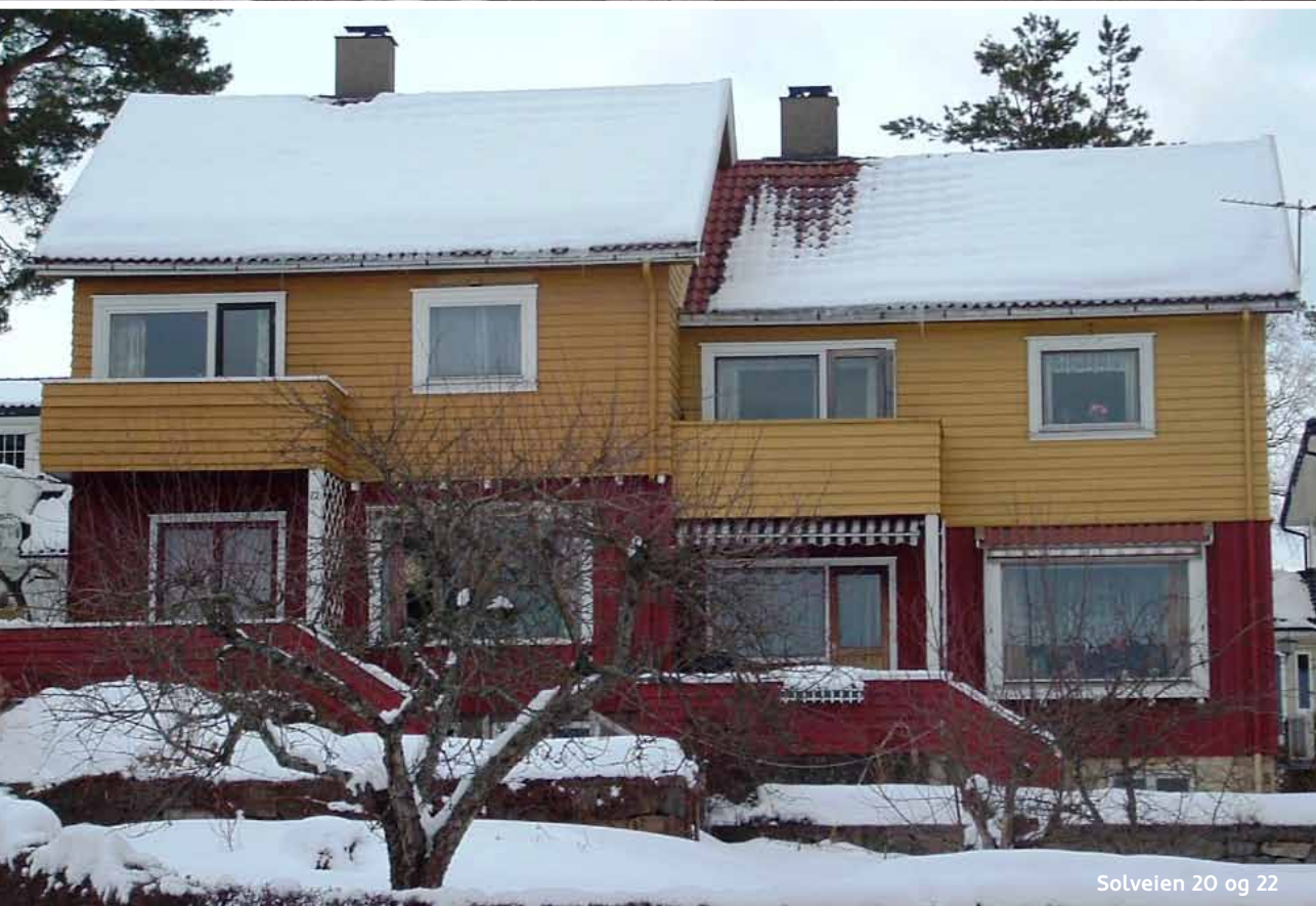
Solveien 20 og 22