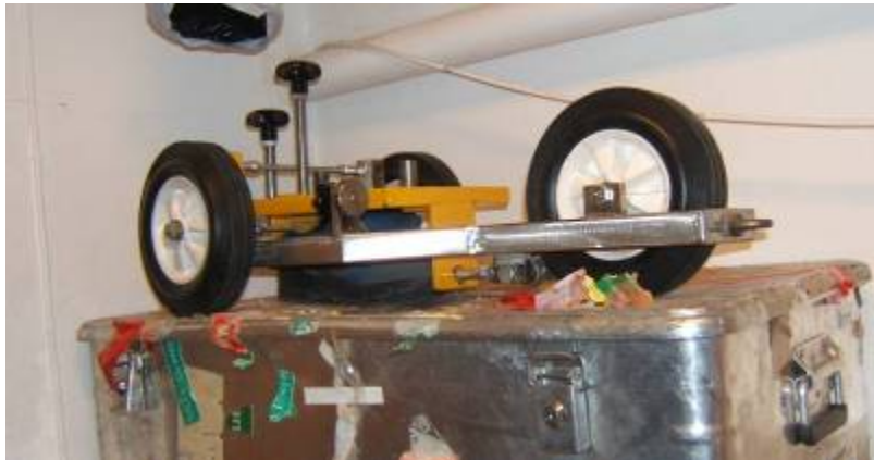
Vogn med fot