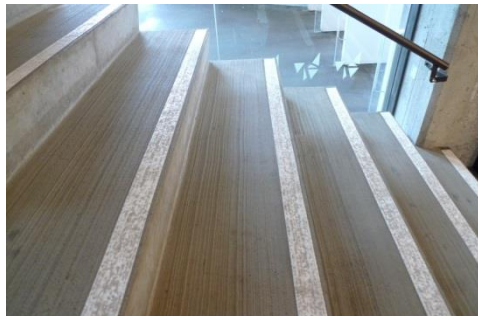
Foto 1a og 1b: Eksempler på tiltak for sklisikring i trapper. Det ene gjennom produkttegenskaper og det andre gjennom overflatebehandling.